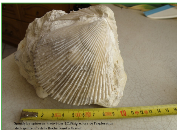
Spondylus spinosus, trouvé par J.C.Staigre, lors de l'exploration de la grotte n°2 de la Roche Fouet à Orival