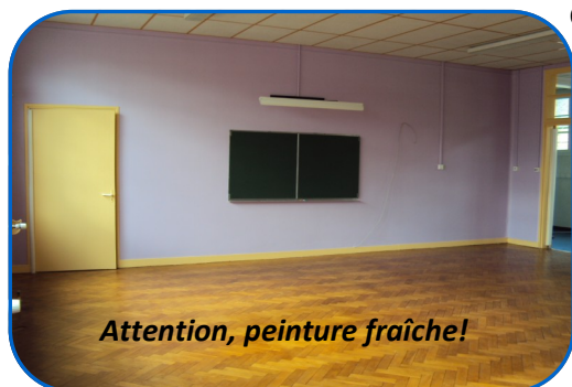
Attention, peinture fraîche!