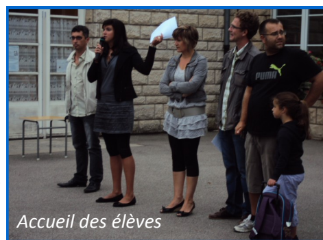
Accueil des élèves