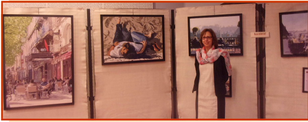
L'exposition de peinture salle Val Doré et la Fête de la Noix