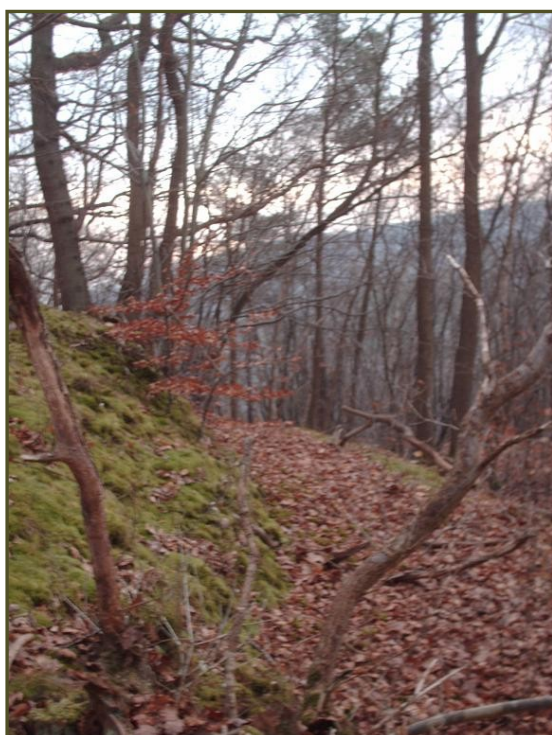
L'une des très nombreuses levées de terre d'Orival, ici en surplomb de la côte de Moulineaux

Même si Orival a pu être occupé par l'homme entre -10 000 ans et -200 ans avant Jésus Christ, nous n'avons aucune preuve tangible, quelques vestiges retrouvés en périphérie nous laissent quelques traces ténues, mais les plus visibles sont celles de ceux que l'on appelle communément les Gaulois, qui sont en fait des tribus Celtes. Il y eu en effet plusieurs vagues d'invasions Celtes à l'âge du fer (- 800av J.C.), la dernière eu lieu sur l'actuelle Seine Maritime vers -450 à la période dite de "la Tène" par des tribus Belges, les Calètes, nous rappellerons qu'à cette époque le 'l' se prononce 'ou' un peu comme en portugais ; nous avons donc affaire à des "caouètes" qui ne donnèrent pas leur nom à un ingrédient pour un apéritif réussi, mais bien au pays de Caux !